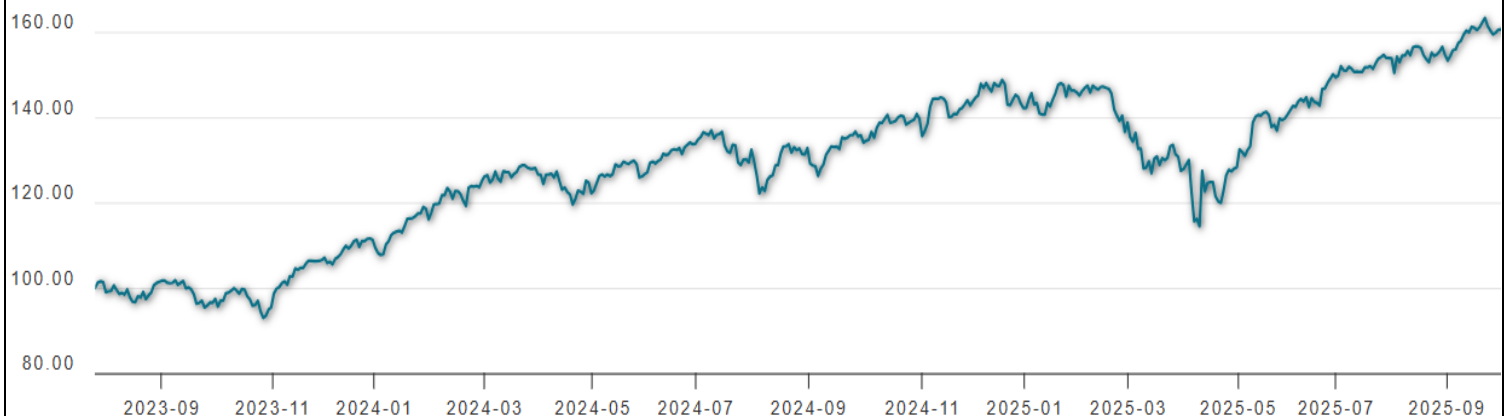
威廉博萊美國大型成長基金 - J 累積(美元)